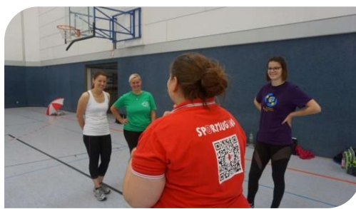
Fortbildung „Kinder spielend bewegen“ der Sportjugend Sachsen-Anhalt